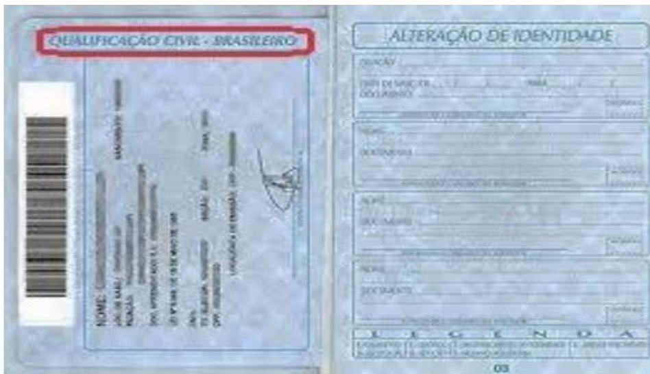
Página de qualificação civil: é a página que possui as informações pessoais