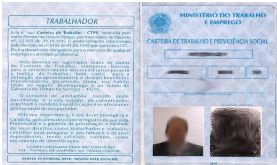
Página onde consta a foto: é a página que possui a foto e a impressão digital